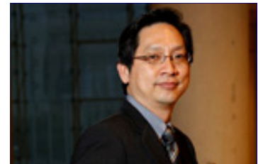
A la izquierda, vista de la Sala Madrid del Palacio Municipal de Congresos. Sobre estas líneas, Bruce Schneier y Meng-Chow Kang