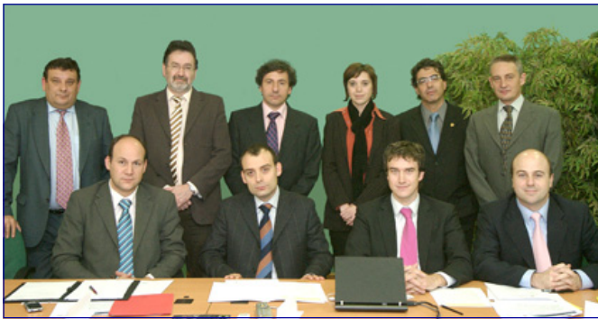
Reunión de los socios fundadores, 30 de enero de 2007

El principal objetivo es impulsar el conocimiento e implementación de los Sistemas de Gestión de la Seguridad de la Información en España, con tres premisas básicas: transparencia, objetividad y neutralidad.