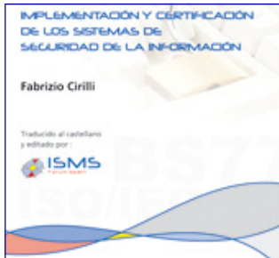
Portada de la primera publicación de ISMS Forum Spain, impresa en mayo.

En el transcurso de esta I Jornada se presenta y entrega a todos los asistentes la primera publicación de ISMS Forum Spain: el Manual de Implementación y Certificación de los Sistema de Seguridad de la Información, traducido al castellano a partir de un acuerdo con CLUSIT, y cuyo autor es Fabrizio Cirilli , otro de los ponentes en la jornada y presidente del ISMS IUG Italy.